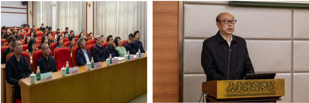
图3 本科教育教学审核评估整改工作推进会

梳理整改内容，充实问题清单、建立责任清单、明晰任务清单，把整改融入学校“十五五”发展规划，精准锚定整改重点任务，靶向破解发展难题。三是加强组织领导，讲求整改成效。