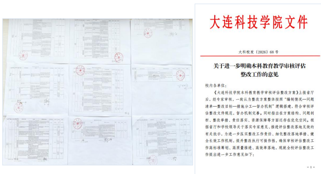
图4 整改问题责任签订表与整改工作意见

根据整改工作领导小组指示和省厅有关精神，为进一步细化整改落地举措、健全长效工作机制，提升整改执行可操作性，制定下发了学校《关于进一步明确本科教育教学审核评估整改工作的意见》（简称“整改工作意见”）通知。文件从“强化问题导向和目标引领、同步编制佐证材料清单、聚焦问题根源进行整改、细化整改措施量化指标、压实整改责任与验收机制、及时构建整改长效固化机制、明确整改效果检验的标准依据”方面提出了具体落实意见，推动整改高标准筹划、高质量推进，经得起检验，切实助力学校教育教学质量与管理水平持续提升。