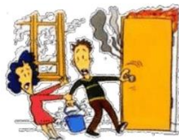
火灾发生时先了解火势