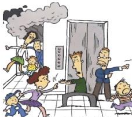
切勿选择电梯逃生